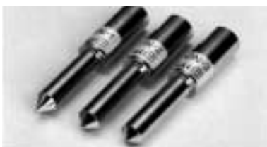
PON-1, PON-2, PON-3