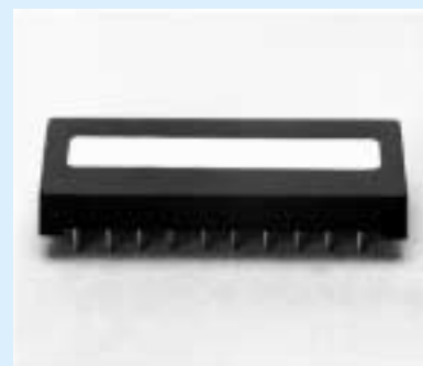
シール (328ページ参照) を貼って完成。