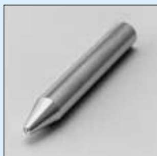
HTX-1 ~ 6