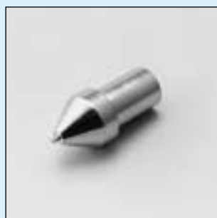
HTX-11 ~ 14